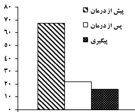
پوشنامه فراشناخت هراس اجتماعی

نمودار ۱- نمرات پیش از درمان، پس از درمان و پی‌گیری در مقیاس‌های هراس اجتماعی و فراشناخت هراس اجتماعی